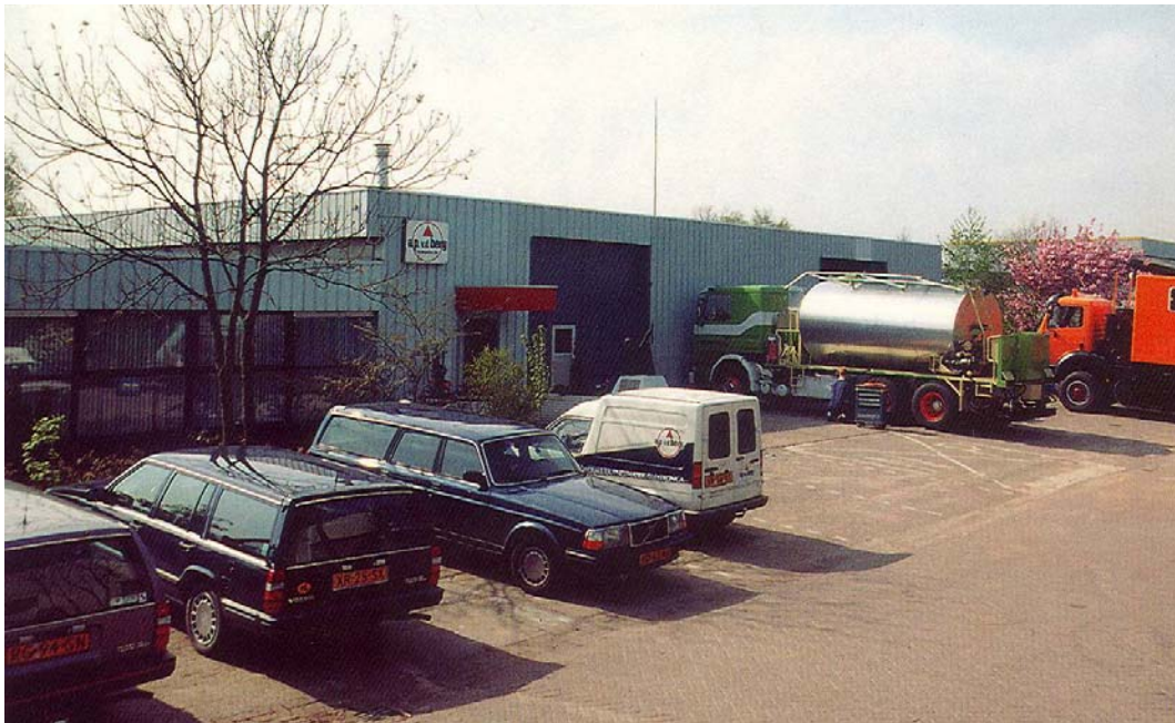
De A.P. van den Berg vestiging te Heerenveen